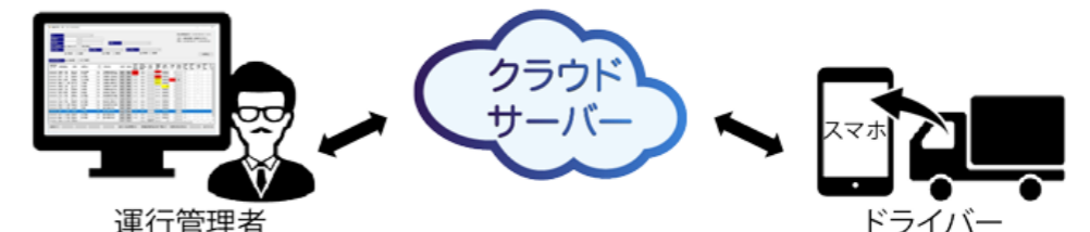
ドライバーへの情報はスマホに、管理者への情報はパソコン画面に表示されます。

乗務員時計アプリのご利用によって、出勤から退勤までの動態管理が行えるようになり、車両運行中に管理したい、「時間」、「場所」、「作業内容」が手に取るようになります。また、運行データから最新の労働状況（走行可能時間、休憩時間、拘束時間等）が自動で算出され、管理者とドライバーへリアルタイムに配信されることから、改善基準告示に則した労務管理を実現します。さらに、運行管理者が日々作成する点呼管理、乗務日報を簡単に作成することができます。 トラック、バス、タクシー会社様の「働き方改革」「残業時間管理」「改善基準告示の遵守」を確実にサポートし、ホワイト経営（運転者職場環境良好度認証制度）の三ツ星取得の効果的なツールです。